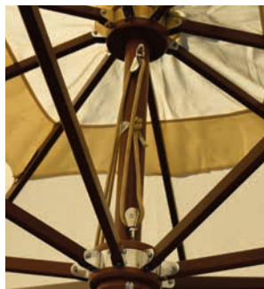
Abbildungen: Belvedere (Olefin-Bezugsstoff), Pixel (Sunproof Bezugsstoff), Samba Novo (Olefin-Bezug)