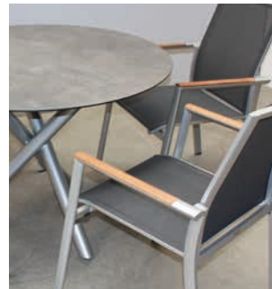
Abbildungen: Bee (Alu, Teak), Fly (Alu), Fly/Sela (Alu, HPL)