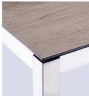
Abbildungen: Florence (Stahl, Teak), Onyx (Edelstahl), Opus/Sela (Edelstahl, HPL)