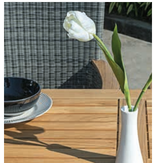
Abbildungen: Bueno (Teak), Onyx/Oryx (Teak, Edelstahl), Status (Teak, Geflecht)