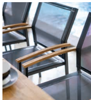
Abbildungen: Novus (Geflecht), Alex (Textilen), Alex (Textilen)