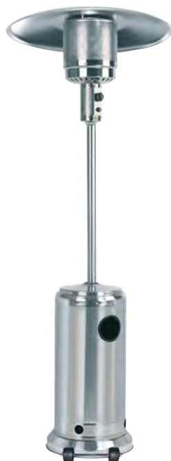
Garden Sun 13 kW H = 224 cm / ø 88 cm F 2206 385.-

Parasol chauffant en acier inoxydable. Réflecteur en aluminium. Allumage automatique. Réglage progressif. Sécurité (stop-gaz). Bouteille de gaz propane 10.5 kg logée dans le socle (avec roulettes de déplacement). Housses de protection disponibles séparément.