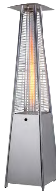
Ambi Sun 8 kW H = 221 cm F 2204 640.-

Parasol chauffant d'ambiance en inox. Il combine éclairage (sa flamme dansante dans le tube en verre) et chauffage, et mettra ainsi en confort absolu vos invités et convives pour les fraîches journées d'été et même d'automne dans votre espace jardin! La bouteille de gaz peut être logée pratiquement dans le socle.